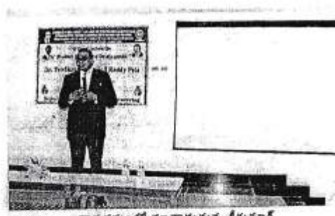
కార్యక్రమంలో మాట్లాడుతున్న శ్రీమూర్తి